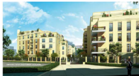
Chantier CHARENTON - GABRIEL PERI

De fait, en gérant les dossiers de suivi de chantier avec FileDirector™ (courriers, plans, historiques, révisions, diffusions, génération de rapports, etc.), VINCI Construction France permet également la production d'une archive globale et à valeur probante, des documents qui encadrent son activité.