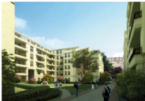
Chantier CHARENTON - GABRIEL PERI

FileDirector™ dispose en outre d'une suite d'applications Web en mode ASP qui stockent les données d'indexation sur un serveur de base de données, tel que MSSQL Server™ ou ORACLE™, et les documents XML sur un pool de stockage.